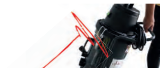
Poignée de poussée