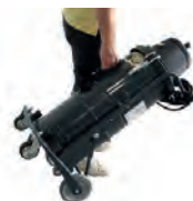
Poignée à la verticale pour un transport facile