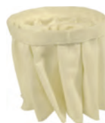
Filtration à poches Grande surface filtrante