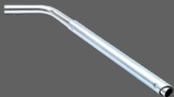
Capteur à air additionnel Capteur vrac

Découvrez nos accessoires spécifiques d'aspiration, pour répondre à toutes les demandes ! Retrouvez l'intégralité de nos accessoires sur notre site www.pharaon.fr