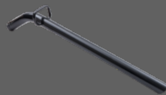
Tube en aluminium avec poignée