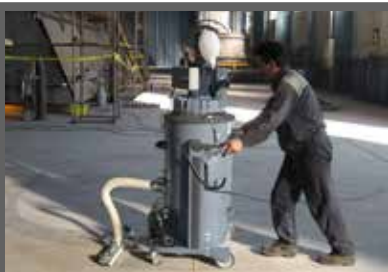
Capteur Fixe Wet & Dry Largeur 700 mm