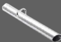
Lance avec poignée en aluminium de longueur 50 cm