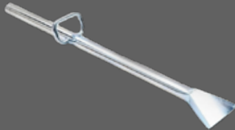
Capteur raclant en acier de longueur 120 cm