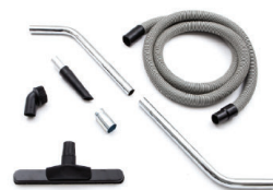
Kit accessoires intégré avec flexible antistatique