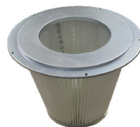
Filtration conique antistatique M